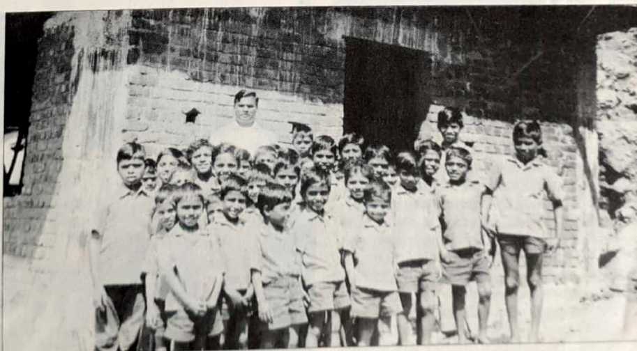
Die Waisenkinder vor dem Rohbau des Schlafsaales.