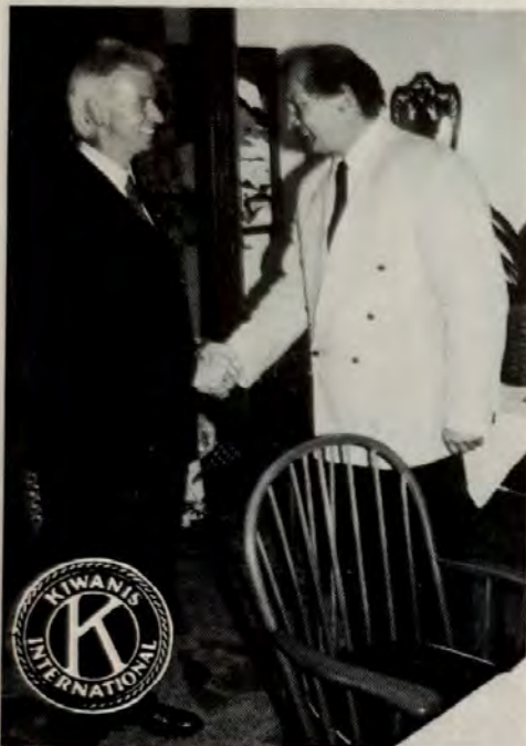
Lieutenant Governor KR Erwin Steiner (links) und Präsident Alfred Gschnaller.

Bei der Jahreshauptversammlung des Kiwanis Club Kitzbühel im Juni wurde für das Clubjahr 1989/90 ein neuer Clubvorstand gewählt.