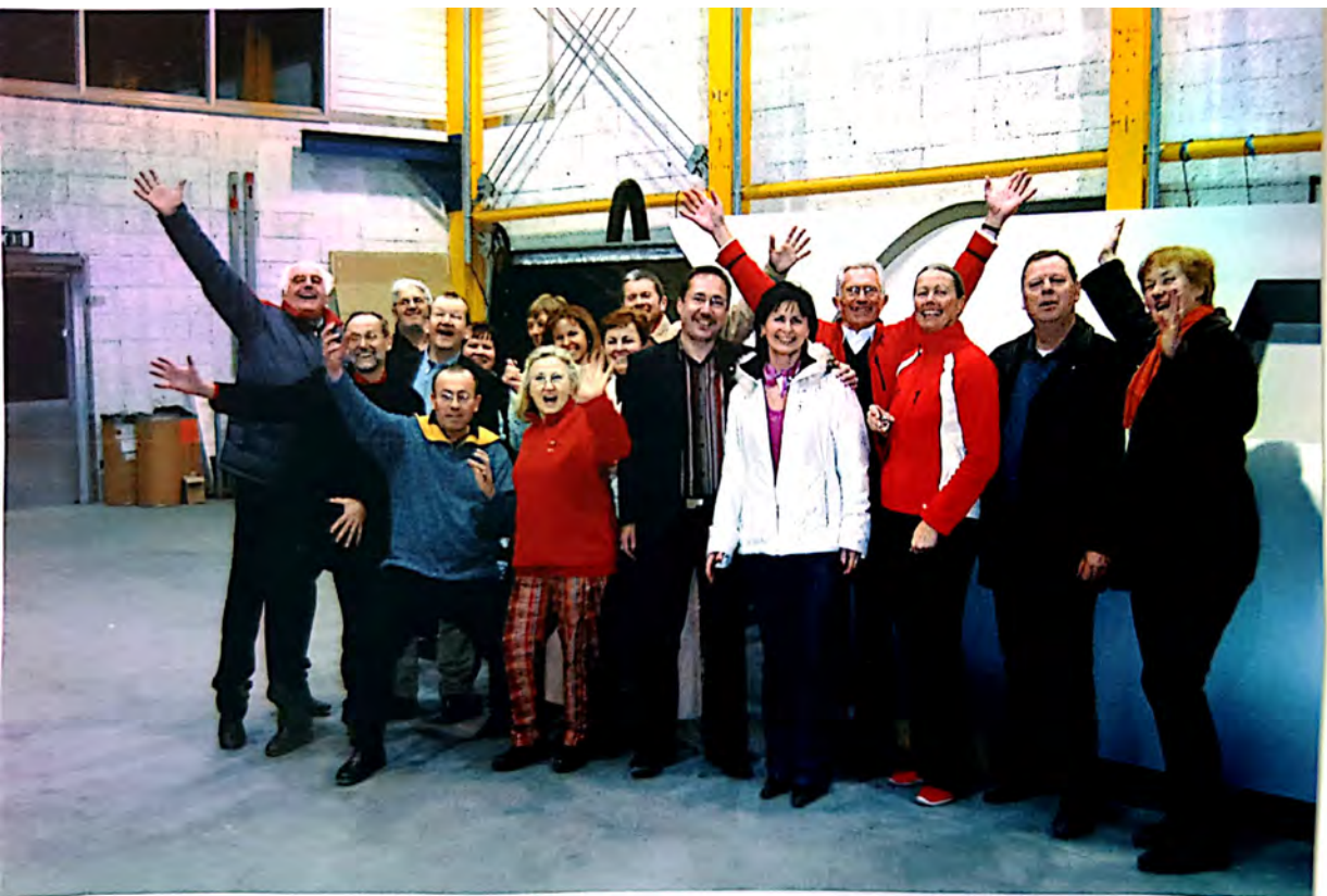
Training in der Halle Valenta „Salsa Tanz“ 28.1.2005